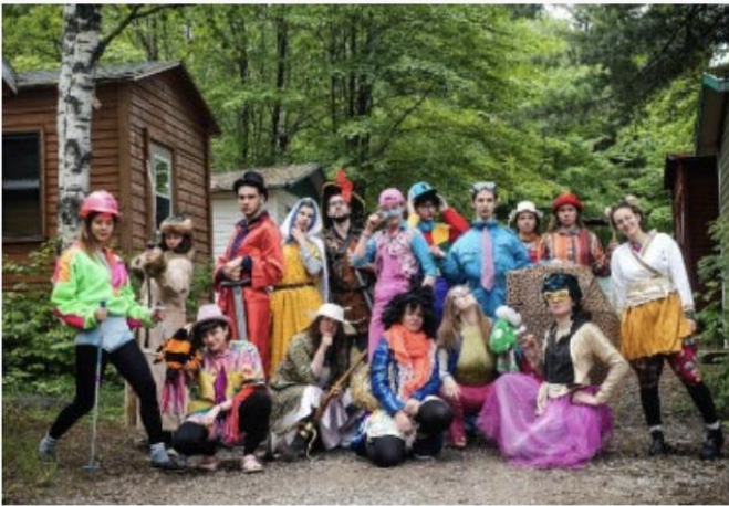
Camp musical Fernand-Lindsay

Plus de 850 jeunes musiciens-nes provenant de familles à revenus modestes ont pu séjourner au Camp avec l'aide financière de la Fondation.